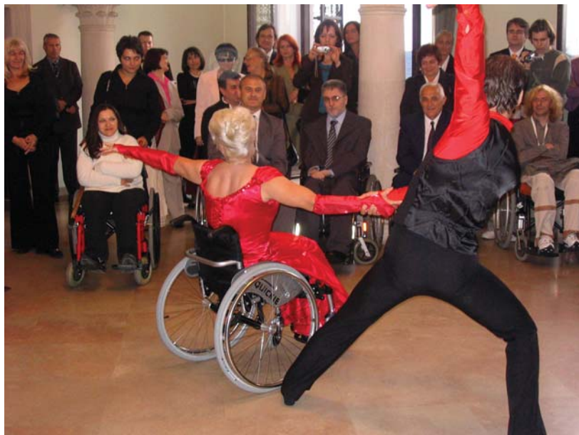
Неке особе са инвалидитетом воле да играју, баш као и неке особе без инвалидитета

Највећи број индивидуалних права грађана и грађанки остварује се у локалној средини у којој се непосредно задовољавају свакодневне потребе и интереси особа са инвалидитетом. То је разлог што институционалне аранжмане који се формирају на локалном нивоу треба прилагодити обавези локалних власти да и на локалном нивоу воде политику једнаких могућности за остваривање права и њихово уживање под једнаким условима и без дискриминације по основу инвалидитета.