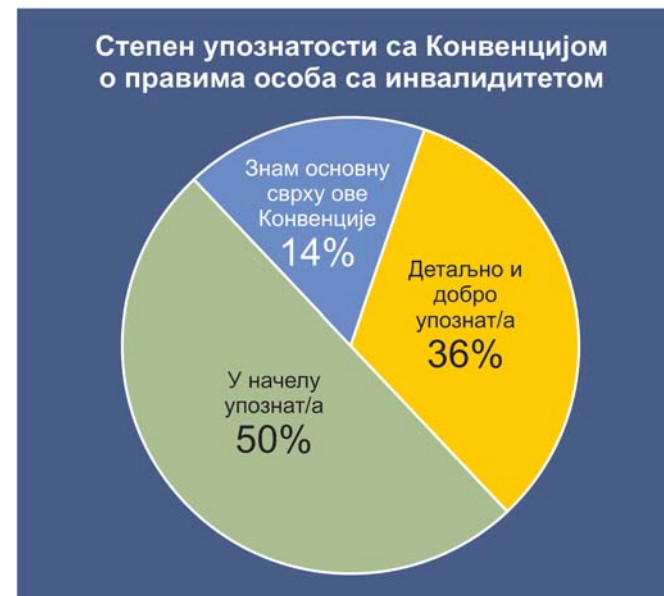
Графикон 1: Самопроцена упознатости народних посланика са Конвенцијом о правима ОСИ

Већина народних посланика проценила је да је детаљно и добро упозната са Конвенцијом о правима особа са инвалидитетом (67%), а нешто мање са домаћим антидискриминационим законодавством (39.29%), док већина (57.14%) зна основна начела и стандарде у овој области.