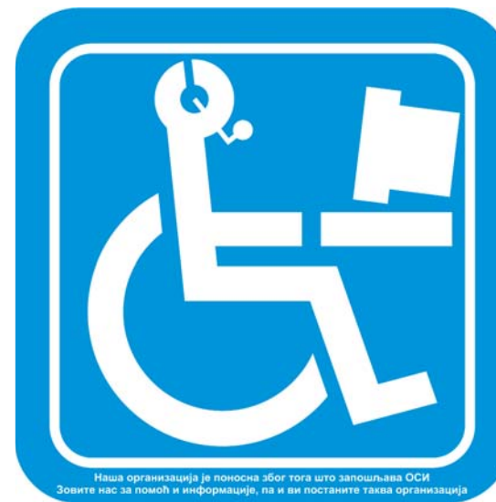
Пример налепнице коју користе послодавци који запошљавају ОСИ у другим земљама као део афирмативне акције

» Приликом разматрања евентуалних измена Закона о раду, не сме се умањивати постојећи законом гарантован ниво заштите права особа са инвалидитетом. Те измене могу се искористити и за развијање концепта разумних прилагођавања радног места и процеса рада, у складу са одредбама Конвенције и разматрање могућности враћања одредби о четворочасовном радном времену за ОСИ.