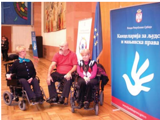
Удружења ОСИ имају значајну улогу у заштити права ОСИ

Због значаја овог питања за практичну примену људских права ОСИ и њихову ефективну заштиту, а имајући у виду да су