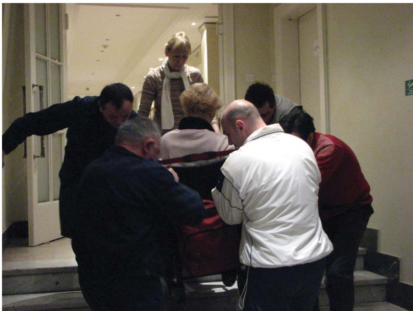
Слика 2: Када нема рампе, петорица љубазних службеника уноси особу у инебалидским колицима у зграду Народне скупштинезграде у Краља Милана. На овом месту је постављена покретна платформа априла 2007. и омогућен несметан прилаз до сале за пленарне седнице.

Неопходно је разрадити опште одредбе о доступности јавних информација и електронских комуникација особама са инвалидитетом и донети подзаконска акта са прецизнијим техничким смерницама како јавне информације и електронске комуникације учинити приступачним особама са инвалидитетом.